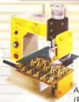
AJ-02型割板機 (PC板移動式)