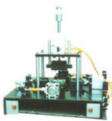
特殊零件成型機(可訂做)