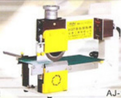
AJ-11型割板機 (PC板移動式)