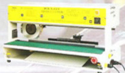
AJ-20型割板機 (PC板固定式)